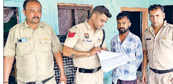
कैथल। नशा को रोकने को लेकर घरों की जांच करती पुलिस टीम।

एसपी आस्था मोदी के निर्देशानुसार डीएसपी कुलदीप बेनीवाल के नेतृत्व में कैथल पुलिस लगातार प्रयासरत है। एसपी आस्था मोदी के आदेशानुसार नशा जागरूकता टीमें घर घर जाकर लोगों से संपर्क स्थापित कर रही है। इस दौरान उक्त टीमों ने संदिग्ध नशा तस्करो की लिस्ट तैयार की गई है। पिछले दिनों से उक्त टीमें सीवन थाने के अंतर्गत के गावों में आमजन से मिल रही है। जो उक्त टीमों द्वारा आमजन से संपर्क स्थापित करके तैयार की गई संदिग्ध नशा तस्करो