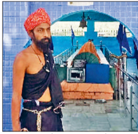
कलायत में फकीर बाबा नौगाजा पीर धार्मिक स्थल पर मौजूद महंत मुनि महाराज

सदियों बाद कलायत के वाई एक स्थित प्राचीन फकीर बाबा नौगाजा पीर धार्मिक स्थल पर मुर्गा चढ़ाने पर रोक लगाने की पहल हुई है। धार्मिक स्थल के मुख्य द्वार पर मुर्गा चढ़ाना सख्त मना है का संदेश देने के लिए पोस्टर भी चस्पा किए गए हैं। इसके साथ ही इस स्थल पर शराब व अन्य नशीले पदार्थ लेकर आने की भी मनाही रहेगी। यह बड़ा फैसला धार्मिक स्थल के मुख्य महंत