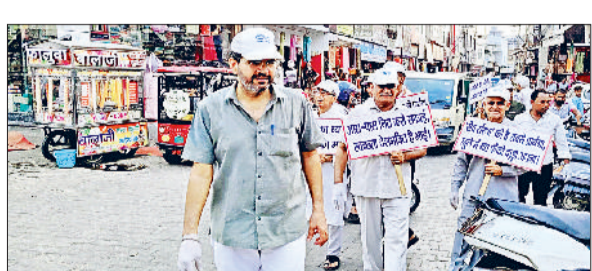
जीद। स्वच्छता जागरूकता अभियान चलाए सेव संस्था सदस्य।