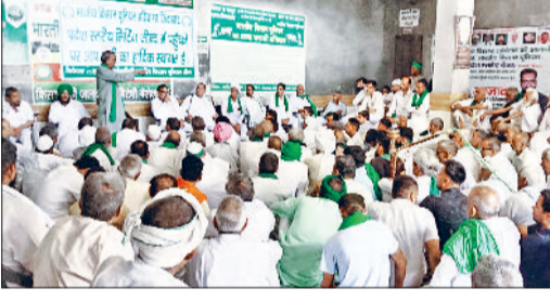
जीद। बैठक में भाग लेते किसान।