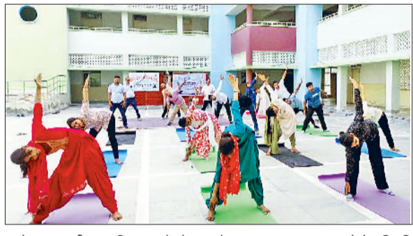
अलेवा। राजकीय महाविद्यालय में योग करते स्टाफ व छात्र।

सेना में शामिल होकर कैडेट देश की सेवा और राष्ट्रीय सुरक्षा में योगदान कर सकते हैं। कैंप कमांडर का व्याख्यान एनसीसी कैडेटों के लिए बहुत प्रेरणादायक था। इसने उन्हें भारतीय सेना में शामिल होने के विभिन्न लाभों के बारे में जागरूक किया और उन्हें अपने लक्ष्यों को प्राप्त करने के लिए प्रेरित किया। दिन की गतिविधियों में