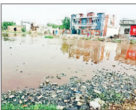
तालाब में गंधयुक्त पानी का दृश्य।

राजौद के तालाब में भरी गंदगी से लोग परेशान राजौद के तालाब पर वार्ड नंबर 6 में तालाब में भरी गंदगी से लोगों का जीना दुश्धार होकर रह गया है। आलम यह है कि यहां से गुजरते समय मुंह पर कपड़ा ढांप कर निकलना पड़ता है। इतना ही नहीं इसी तालाब के सामने छोटे छोटे बच्चों का प्राथमिक सरकारी स्कूल भी है जहां प्रतिदिन सैकड़ों बच्चियां शिक्षा ग्रहण करने आती हैं। इस बारे में लोगों ने कई बार संबंधित विभाग को भी गुहार लगाई कि यहां से पानी निकाल कर स्वच्छ पानी भरा जाए। लेकिन समस्या का समाधान नहीं हो रहा। इससे स्कूलों बच्चों के साथ साथ आम जन भी परेशान हो रहे हैं।