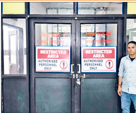
जीद। नागरिक अस्पताल में बना ऑपरेशन थियेटर।