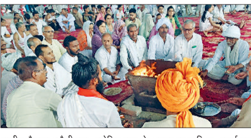
राष्ट्रीय गोशाला धडौली द्वारा आयोजित हवन के अवसर पर उपस्थित आचार्य गण व ग्रामीण।