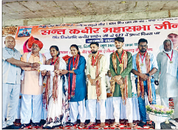
जीद। कार्यक्रम में होनहार छात्रा को सम्मानित करते हुए।

इतना ही नहीं एमबीबीएस का कोर्स कर रही छात्रा ने कहा कि जब मैं नौकरी पर लागूगी तो एक कर्मरे के निर्माण के लिए दान राशि प्रथमिकता के आधार पर उपलब्ध करवाउंगी। जयंती पर 10वीं तथा 12वीं की परीक्षा में 80 प्रतिशत से