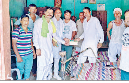
जीद। सदस्यता अभियान चलाए जगपा नेता।