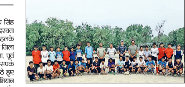
जीद। ट्रायल में चुने गए खिलाड़ी।