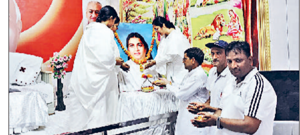
राजौद। मातेश्वरी जगदम्बा सरस्वती जी को पुषा अर्पित कर श्रद्धांजलि देते हुए।