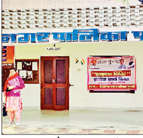
क्या सांसद और विधायक भी इस प्रक्रिया में वोट डालेंगे, लेकिन स्पष्ट है कि वोट केवल 16 पार्षदों और

हरिभूमि न्यूज पंडरी पंडरी नगरपालिका में वाइस चेयरमैन पद को लेकर आज 23 जून को चुनाव होना प्रस्तावित है। शहरभर की निगाहें इसी चुनाव पर टिकी हैं कि क्या वाकई आज वोटिंग होगी या फिर कोई नया मोड़ सामने आएगा। पिछले कई दिनों से शहर में इस बात को लेकर चर्चाओं का बाजार गर्म है। शहरवासियों में असमंजस की स्थिति बनी रही कि