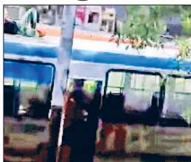
जीद। रात को बस में ही आराम फरमाते चालक और परिचालक।