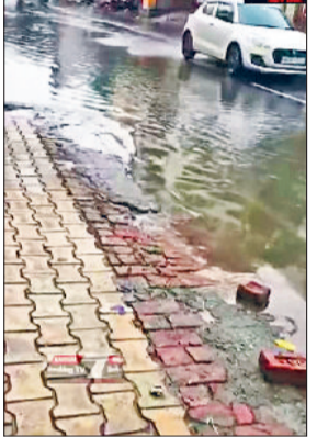
किसानों के चेहरे खिले

हरिभूमि न्यूज कैथल रविवार को दिनभर उमस भरी गर्मी रहने के बाद दोपहर में बारिश ने शहरियों को थोड़ी राहत दी। मानसूनी हवाओं में सुबह ही से बादल छा गए। इसके बाद दोपहर चार बजे हल्की बारिश शुरू हो गई। मौसम विभाग ने 24 जून तक हल्की और मध्यम बारिश होने का पूर्वानुमान जारी किया है। शहर में सुबह से आसमान में बादल छाए रहें जिससे सुबह से गर्मी ने लोगों को बहाल कर रखा था। पिछले तीन दिनों से बारिश होने की आशंका जताई जा रही थी। हालांकि शहर में दोपहर को ज्यादा नहीं हुई 10 से 15 मिनट के दौरान ही बारिश रुक गई जिससे दोबारा फिर उमस बढ़ गई। सड़कों और निचली कालोनियों में जमा हुआ पानी: पहली बरसात में ही जिला प्रशासन के पानी निकासी के प्रबंधों की पोल खुलती नजर आई। नाले जमा होने के कारण कर्नाल रोड, डांड पर दुकानों के सामने करीब एक फीट तक पानी जमा हो गया। इस