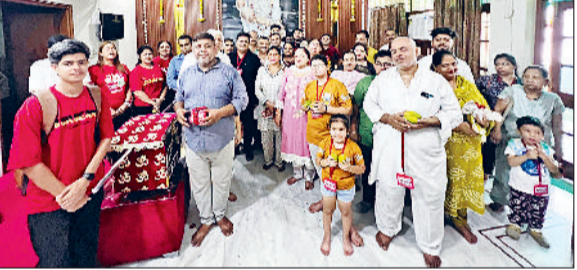
कैथल। शिरडी के लिए रवाना होता श्रद्धालुओं का जत्था।

साई बाबा के प्रति श्रद्धा, सेवा और समर्पण को समर्पित / "साई दर्शन यात्रा" के अंतर्गत आज कैथल से बड़ी संख्या में श्रद्धालु शिरडी धाम के लिए रवाना हुए। यह यात्रा श्री साई रसोई सेवा समिति, कैथल द्वारा आयोजित की जा रही है, जिसमें लगभग 60 से अधिक श्रद्धालु भक्त शामिल हैं। यात्रा का शुभारंभ प्रातः 9:00 बजे पूजा-अर्चना और मंगल आशीर्वाद के साथ किया गया, जिसके पश्चात संगत ने प्रातः 9:30 बजे साई बाबा के पावन दरबार की ओर प्रस्थान किया। इस अवसर पर